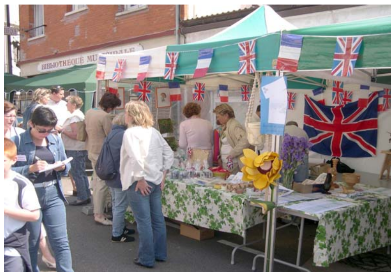
Le stand du CJO pendant la Fête au village