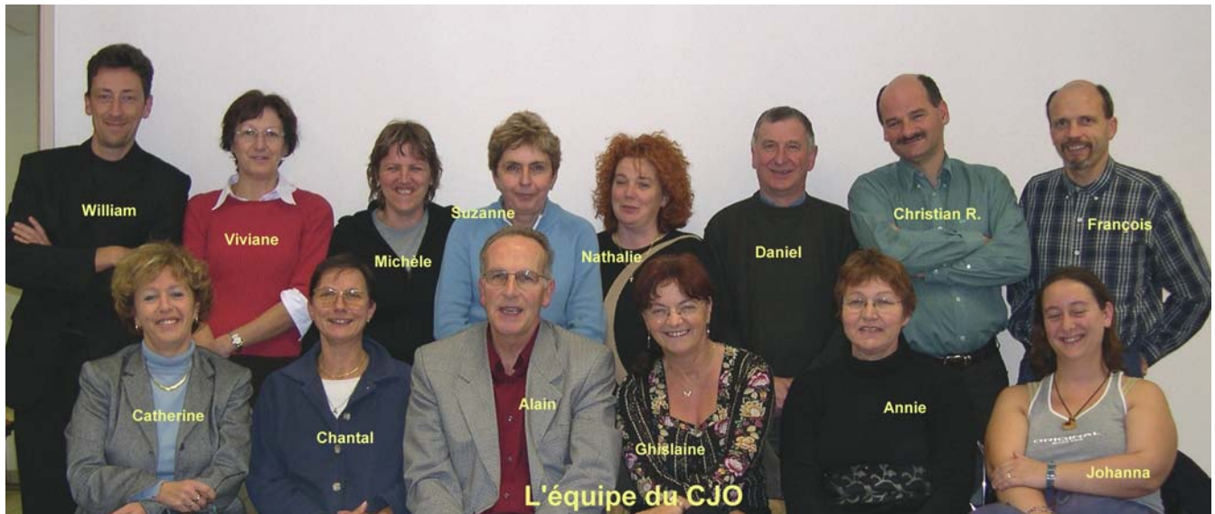
L'équipe du CJO

L'équipe du CJO (hélas incomplète) L'ambiance est excellente, l'équipe a le sourire aussi !!!