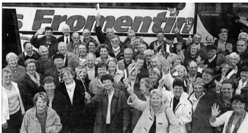
Extrait du tableau électronique de la Mairie

COURS D'ANGLAIS DU COMITE DE JUMELAGE ENCORE DES PLACES NIVEAU 1 ET 2 LUNDI ET MERCREDI DE 18H00 A 19H00 RENSEIG : 0235469589