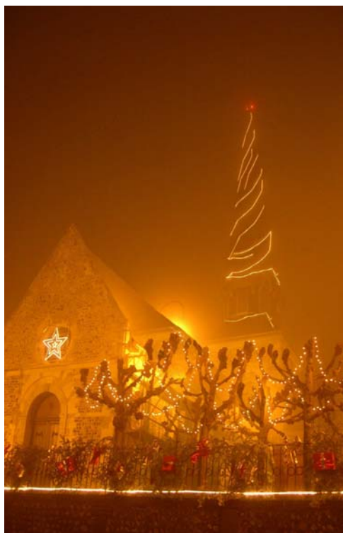
L'Eglise d'Octeville sur Mer dans la brume...