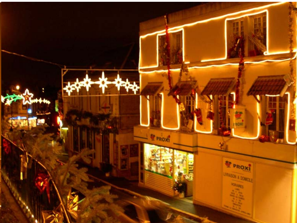
Notre Parade à nous qu'on a, la rue Félix Faure, décorée le soir de Noël...