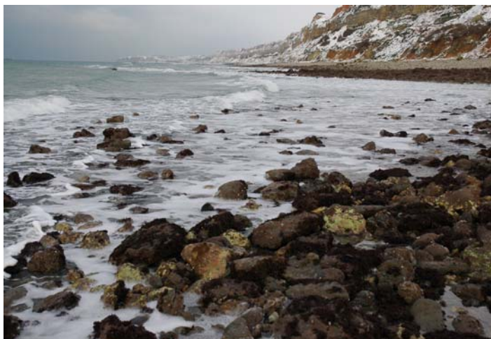
écume et neige