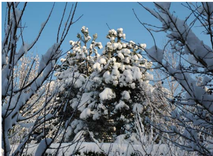
c'est bien tombé !