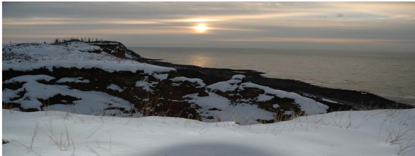
du haut de nos belles falaises...