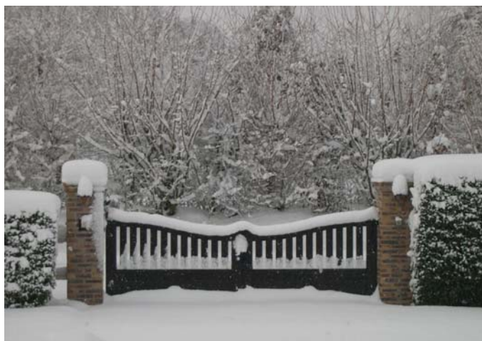
35 cm de poudreuse par endroit