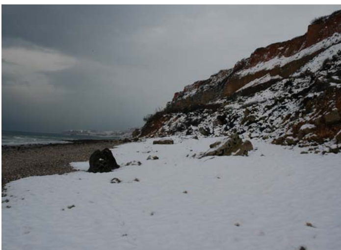
neige à la plage

ENIGME ??? ENIGMA ??? Que peut-il bien y avoir sous les « mottes » de neige ? What can be found under the snow clods ? Vous avez la réponse ? You got the answer ? Ecrivez vite à cjo.octeville@free.fr Send an e-mail to cjo.octeville@free.fr Vous gagnerez peut être l'un des 15 abonnements à la CJO NEWSLETTER You'll perhaps win one of the 15 free subscriptions to the