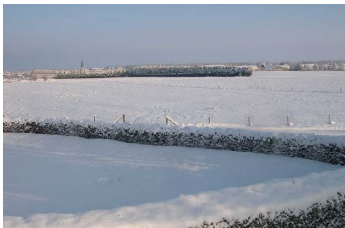
Octeville la blanche