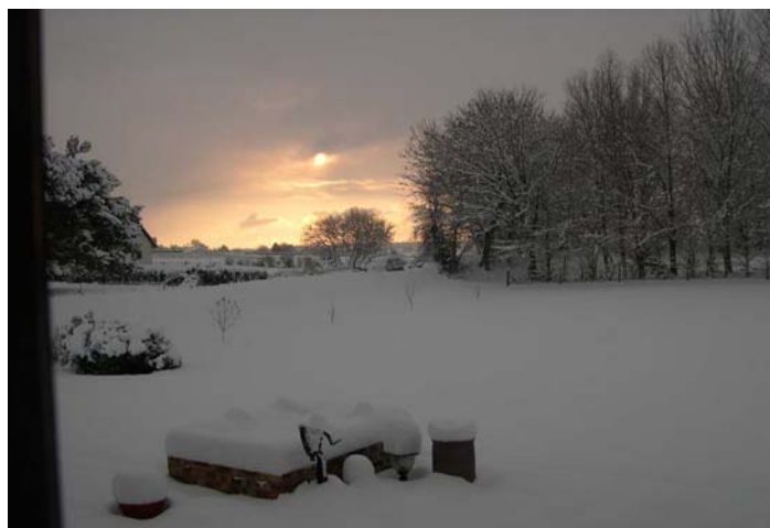
Octeville va s'endormir dans un épais manteau blanc...