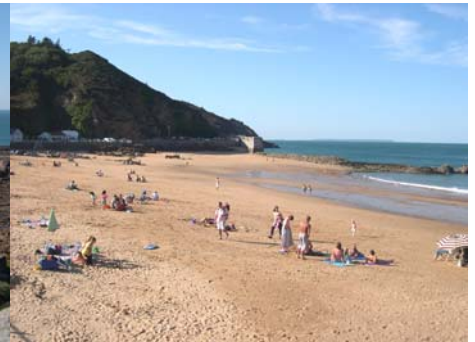
Lecq Beach (Grève de Lecq)