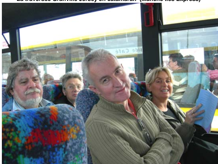
Dans l'un des 2 cars qui nous emmène à la Orchid Foundation