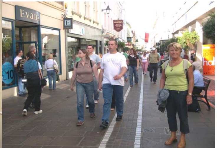
Balade dans Main Street