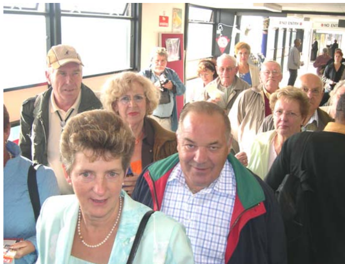
Contrôle des cartes d'identité dans le terminal de St Hélier (JERSEY)