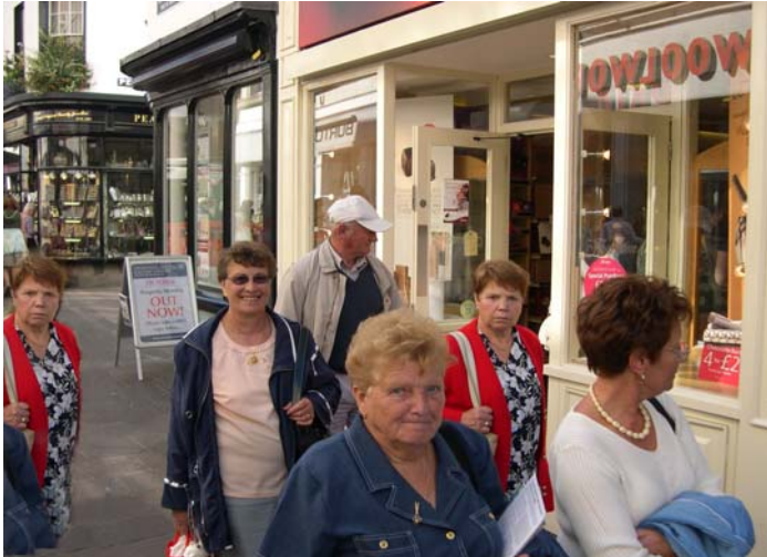
Shopping dans Queen Street à St Héliér, la capitale de Jersey