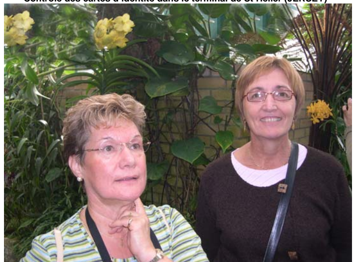
Emerveillement devant les magnifiques orchidées