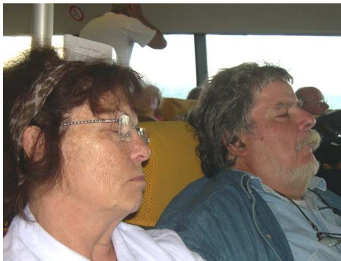
La traversée Granville Jersey en catamaran (Manche Iles Express)