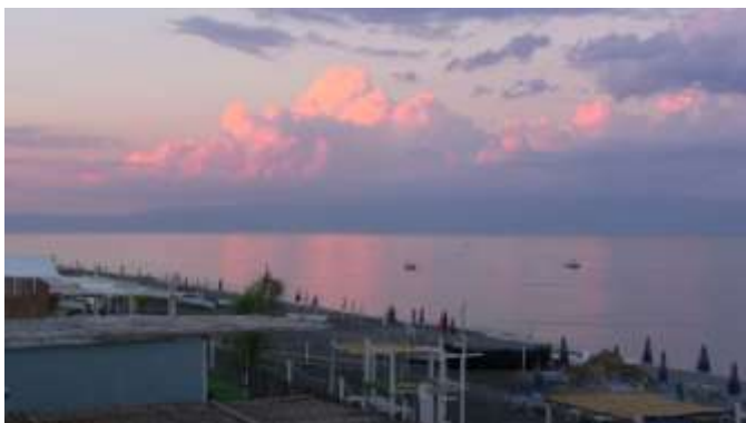
Front de mer de Furci Siculo

Ce soir jusque très tard, pendant plus d'une heure, promenade très sympathique sur le front de mer.