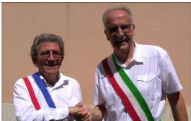
Les écharpes sont échangées