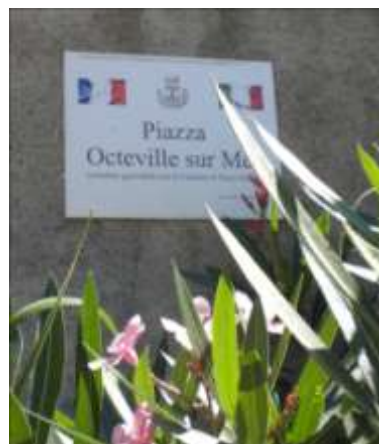
La piazza Octeville sur Mer

La lune (dernier quartier) se lève sur la Mer Ionienne. Apéritif au champagne italien, au menu fruits de mer arrosés de vin blanc sicilien et pour finir un gâteau rappelant la plaque qui avait été dévoilée sur la façade de la mairie quelques jours auparavant : " Les communes de Furci Siculo et d'Octeville sur Mer se sont jumelées en 2010, c'est pour toujours".