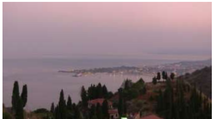
Depuis Taormina vue sur Naxos le site où les Grecs ont débarqué en 735 BC

Cet après midi, on est tous allés à Taormina., à 15 km de Furci. La ville est construite sur plusieurs pitons rocheux qui surplombent la mer Ionienne. L'endroit est tout simplement magnifique.